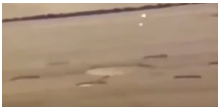
Extrait d'une vidéo montrant la formation de crops circle, par deux sondes envoyées par des entités SDS positifs.

Un crop circle d'origine SDA, n'est donc pas autre chose qu'un signal magnétique exprimé par une pensée soutenue provenant d'une conscience de 6 e densité. Alors que les crops circle d'origine SDS sont générés par un champ magnétique produit par des sondes d'aspect bien matériel.